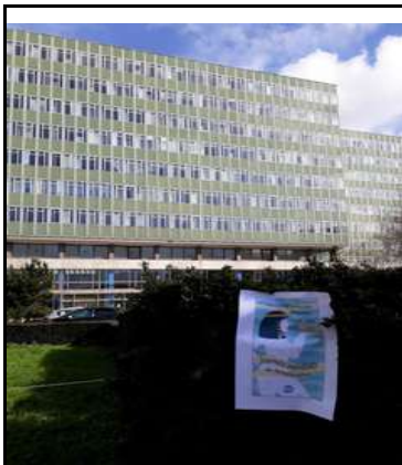
la faculté de médecine