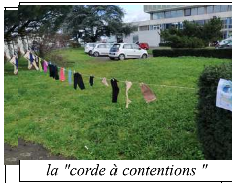
la "corde à contentions"