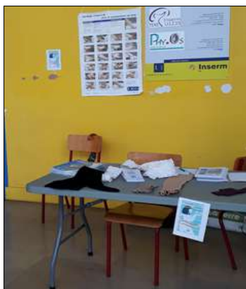
Stand dans le hall de la fac