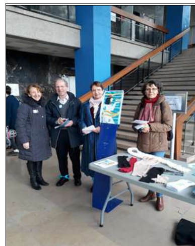
4 bénévoles devant le 2° stand